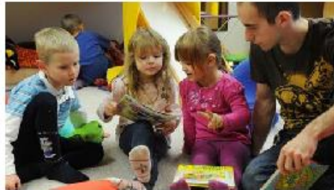
Männliche Erzieher sind in Kindergärten eine Seltenheit.

Die Erziehung von Kindern ist Frauensache – das könnte man denken, wenn man sich die Geschlechterverteilung im Elementarbereich, also in den Kindergärten und Grundschulen, anschaut. Hier gibt es kaum männliche Erzieher und Lehrer. Und wo kein Vorbild, da auch keine Nachahmer – sprich: An dieser Situation ändert sich nichts.