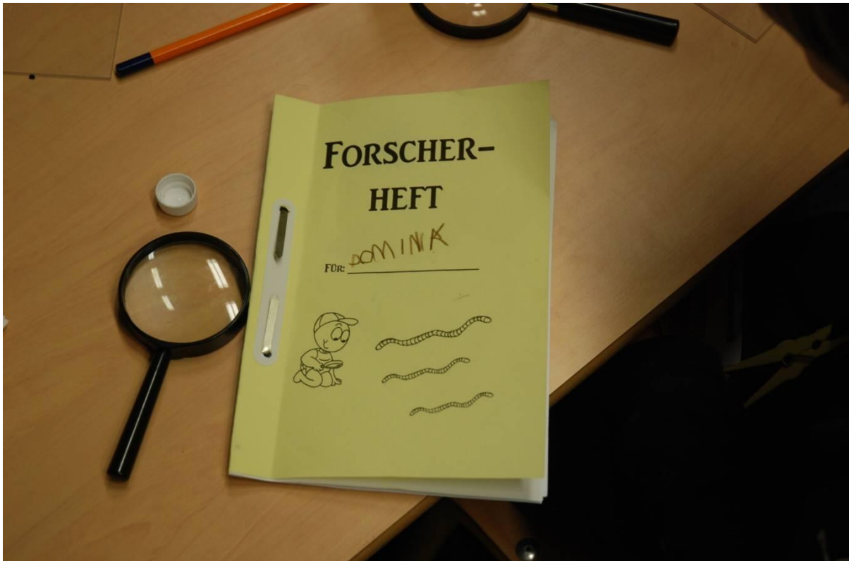
Abbildung 5: Ein Forschungsheft kann zur Dokumentation der Versuche eingesetzt werden.