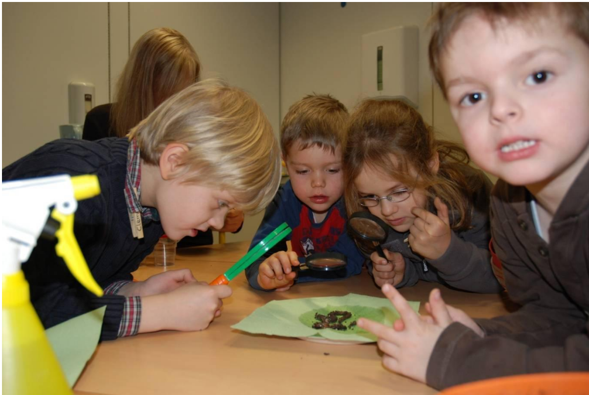
Abbildung 1: Kinder im Elementarbereich zeigen bereits frühes Interesse an naturwissenschaftlichen Fragestellungen

Sodian u. a. verweisen darauf, dass wissenschaftliche Inhalte bereits früh vermittelbar sind, wobei es den Lerneffekt bei jungen Kindern unterstützt, wenn „über den Prozess der Erkenntnisgewinnung in altersgemäßer Form explizit reflektiert wird“ (ebd., S. 18).