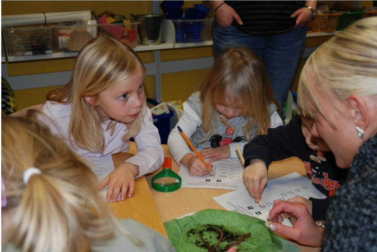
Abbildung 3: Beim entdeckenden Lernen ist es von zentraler Bedeutung auf Fragen der Kinder einzugehen

melt werden (z. B. zum Thema: Können Schnecken hören?) oder es handelt sich um Fragen, die spontan beim Spielen und Handeln entstehen (Abbildung 3).