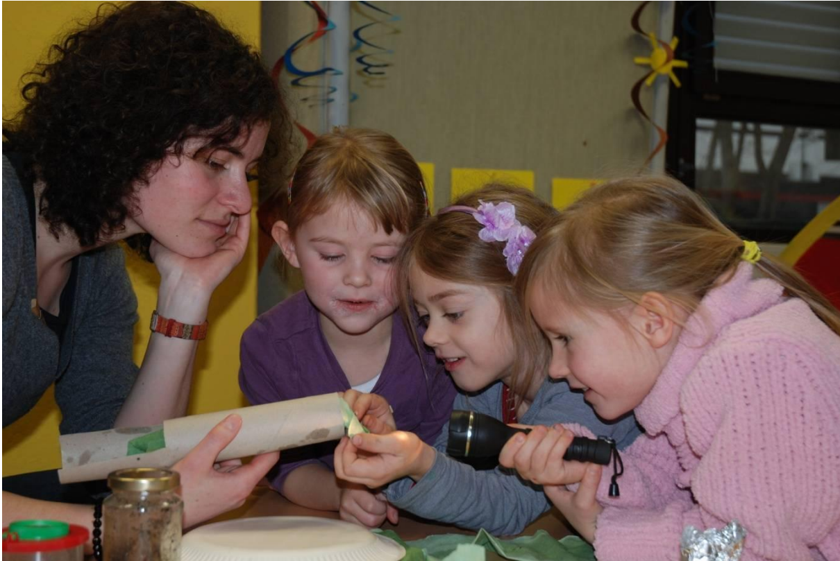
Abbildung 4: Kinder im Elementarbereich beim Experimentieren und Explorieren.

Weiterhin finden sich im Elementarbereich andere Bedingungen als im Grundschulbereich. Der Altersunterschied ist mit ca. drei bis sechs Jahren größer und sehr junge Kinder haben oftmals eine geringere Konzentrationsfähigkeit als Vorschulkinder. Das gemeinsame Forschen aller Kinder im Gruppenraum gestaltet sich daher in der Regel schwierig. Es ist von Vorteil, mit einer kleineren Gruppe von Kindern zu forschen. Lück (2003, S. 102-104) gibt hierzu weitere Empfehlungen.