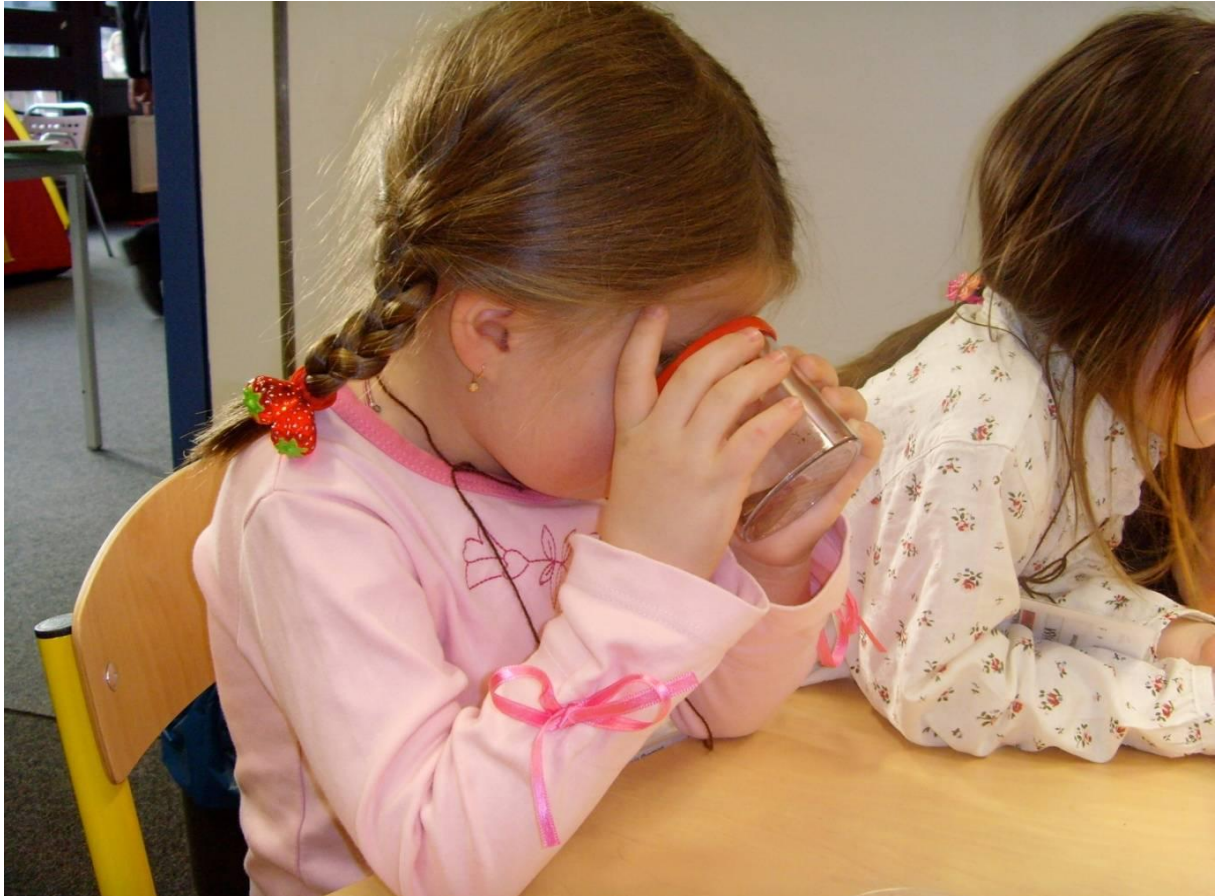
Abbildung 6: Mit Hilfe einer Becherlupe lassen sich verschiedene Kleintiere beobachten.